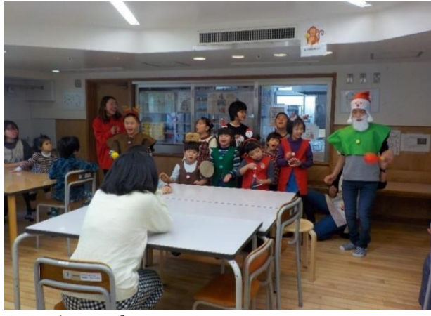
音楽グループ発表「赤鼻のトナカイ」大成功！