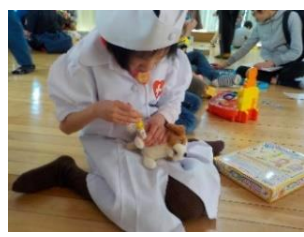
サンタさんからプレゼントをもらってこの表情！みんな欲しいプレゼント貰えたかな??プレゼントに夢中になっている子ども達から笑顔が溢れていました。