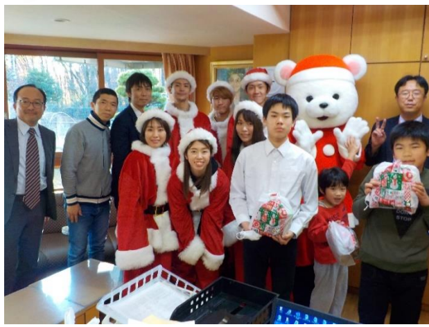
桐生モーターボートさんから、大勢のサンタさんと白くまサンタさんが駆け付けてくれました。たくさんのお菓子をいただきました。