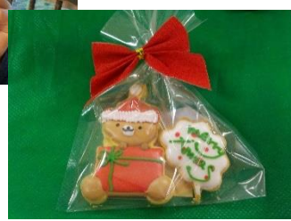
桐生西ロータリークラブの方がサンタクロースに変身！可愛いくまさんのクッキーを子ども達にプレゼントしてくださいました。3人のサンタさんでクリスマス会を盛り上げてくれました。みんなでメリ〜クリスマス〜ス!