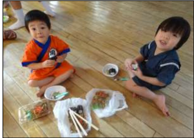
「みてー!」「じんべー!」と嬉しそうに見せてくれた子たちはとても楽しそう！焼きそばにからあげ、フライドポテトにフランクフルト！お腹いっぱい食べて嬉しそう！