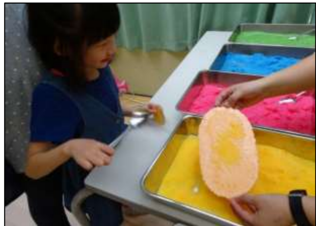
今年新しくやっていたのは、らくがきせんべい！子ども達は各々好きに描いて、好きな色のザラメをかけて楽しみました。ピンクにきいろ、あおにみどり！みんなとっても楽しそう。