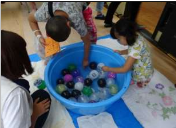
お祭りの定番であるヨーヨー釣りは、やはり子どもに大人気！狙いを定めて…上手にとれたかな？