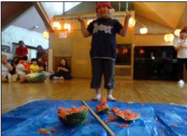
毎年恒例のスイカ割り！今年もとても盛り上がりました！小さい子から大きい子、大人も混ぜて、狙いを定めて思いきりパカーン！上手に割れたね！はい、チーズ！！