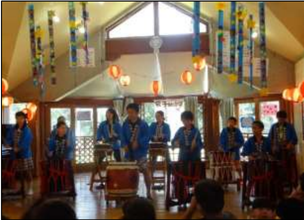
太鼓グループの迫力ある演奏！お父さん、お母さんにかっこいい姿を見せるため一人一人が一生懸命練習してきました！力いっぱい元気な演奏を見せてくれました。