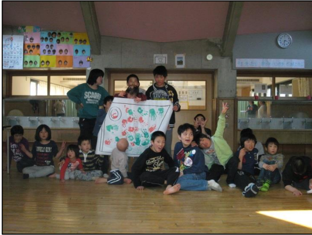
5月5日(日) こどもの日