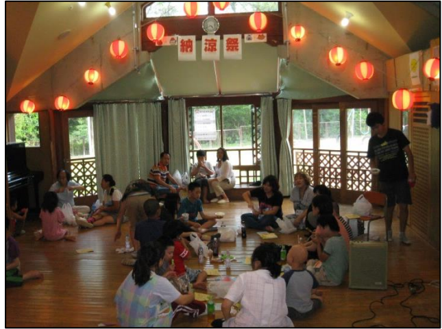
8月18日(日) 親子納涼祭