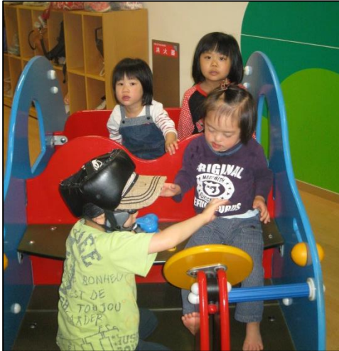
5月30日(木) 幼児部バスハイク