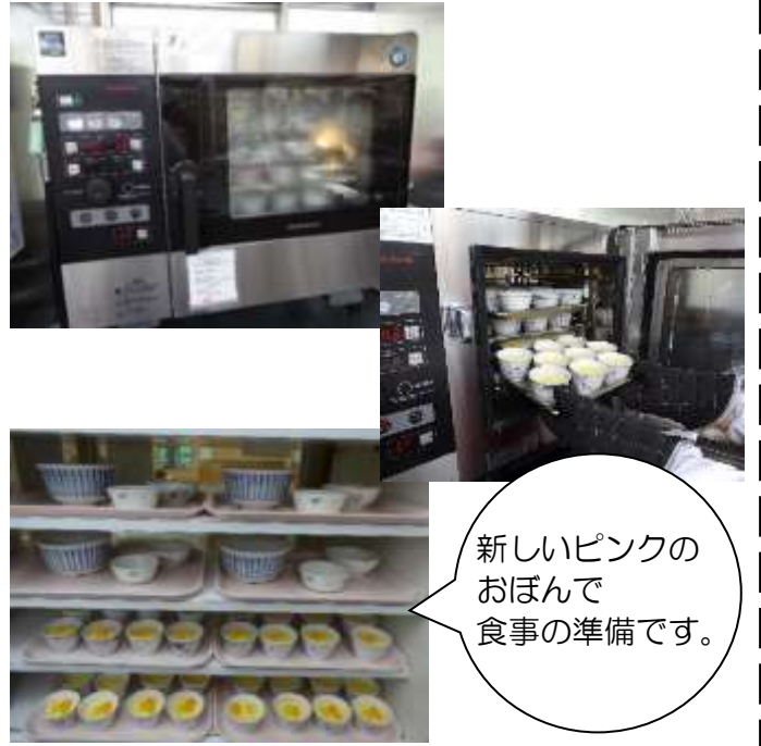
新しいピンクのおぼんで食事の準備です。

一台で焼く・煮る・蒸すなどを、手軽に安定した仕上がりになる夢の様な優れもの。今日もまた、子ども達の「おいしかったよ！また作ってね！」の言葉に大活躍しています。手作りプリンなどのおやつも出来るようになりました。