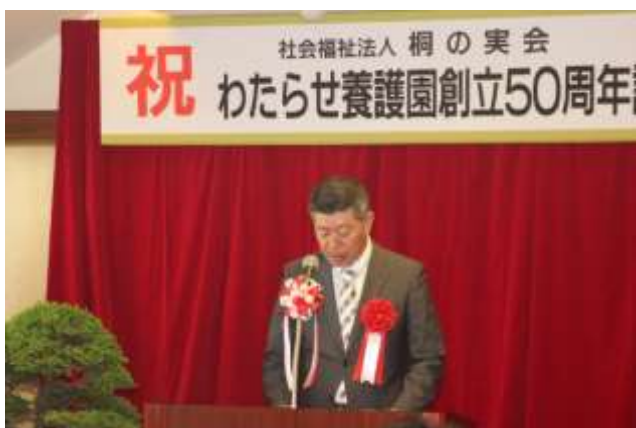
来賓祝辞 群馬県知的障害者福祉協会会長様