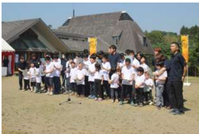
園歌斉唱「わたらせの森から空へ」