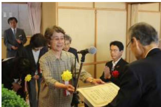
感謝状贈呈 八の会様