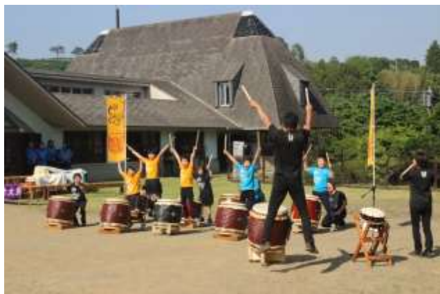
アトラクション 太鼓演奏 障がい児者と太鼓の会 どんどんクラブ様