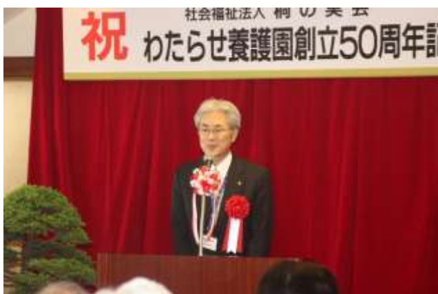
来賓祝辞 群馬県知事様(障害政策課長様)