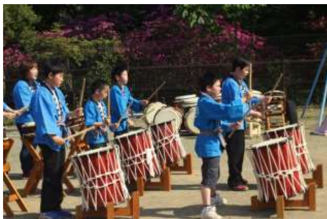
アトラクション わたらせ太鼓 園児・職員