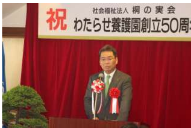
来賓祝辞 桐生市長様