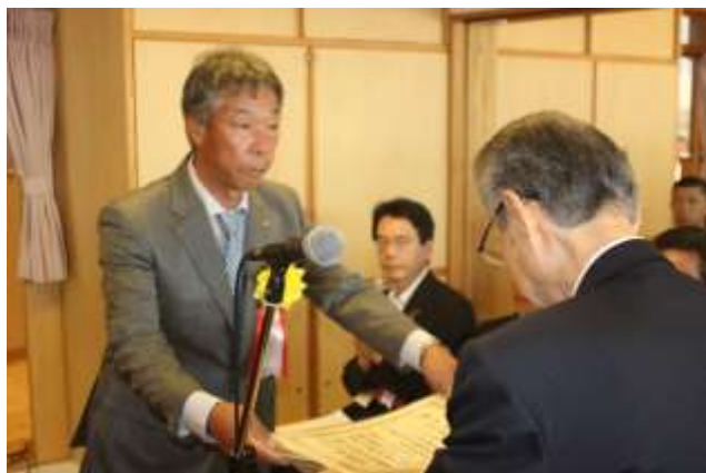
感謝状贈呈 大間々ライオンズクラブ様